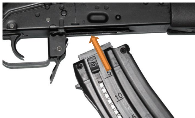
Fot. 5 Podłączanie magazynka