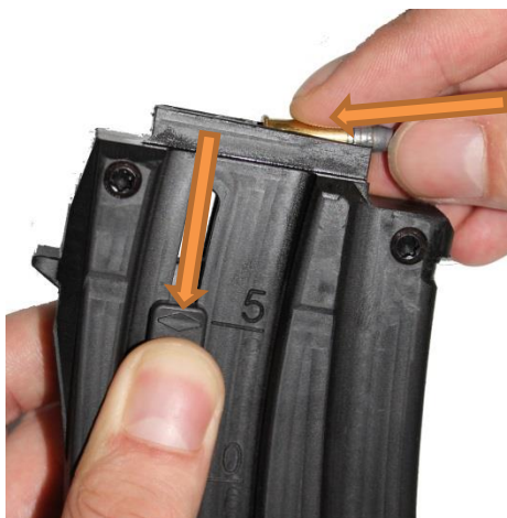
Fot. 4 Ładowanie magazynka

Przycisk suwaka magazynka ściągać powoli w dół, jednocześnie między szczęki magazynka wkładać naboje (fot. 4). Nie używać przy tym zbyt dużej siły. Unikać nadmiernego odciągania suwaka magazynka do dołu.