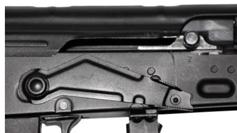
Fot. 2 Dźwignia bezpiecznika w pozycji odbezpieczonej

Pozycja ODBEZPIECZONY – przesunąć dźwignię bezpiecznika na znak „O” (fot. 2).