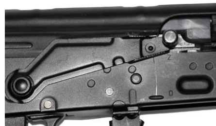
Fot. 1 Dźwignia bezpiecznika w pozycji zabezpieczonej

Pozycja ZABEZPIECZONA – przesunąć dźwignię bezpiecznika na znak „Z” (fot. 1).