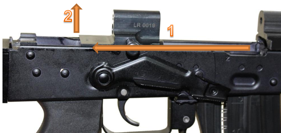
Fot. 9 Odłączanie zamka

Korzystając z wyposażenia (wycior, przecierak, szczoteczka, itp.) należy oczyścić starannie przewód lufy, zamek, komorę zamkową, szczęki magazynka i inne części z osadu prochowego i zanieczyszczeń. W przypadku dużego zabrudzenia wskazane jest przemycie karabinka naftą i dokładne wytarcie. Po wyczyszczeniu, części karabinka w miejscach współpracy należy lekko nasmarować olejem, złożyć karabinek i sprawdzić odręcznie poprawność działania karabinka.