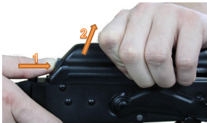
Fot. 7 Zdejmowanie pokrywy