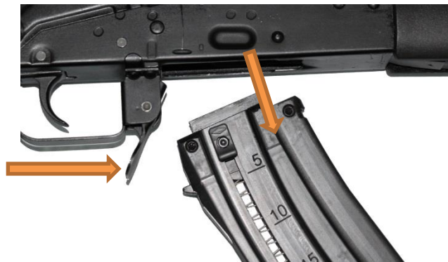
Fot. 3 Odłączanie magazynka

Nacisnąć zatrzask magazynka i wyjąć pusty magazynek wyciągając go w dół (fot. 3).