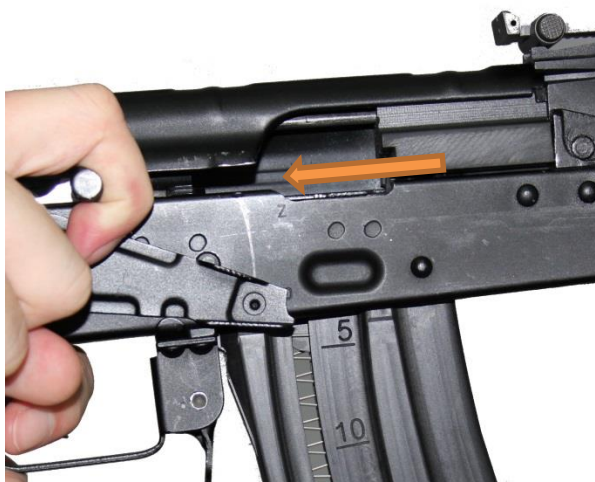
Fot. 6 Odciąganie suwadła

Nabój zostanie doprowadzony do komory nabojoyej. Kurek jest w tym momencie napięty. Należy pozostać w bezpiecznej pozycji aż do oddania strzału.