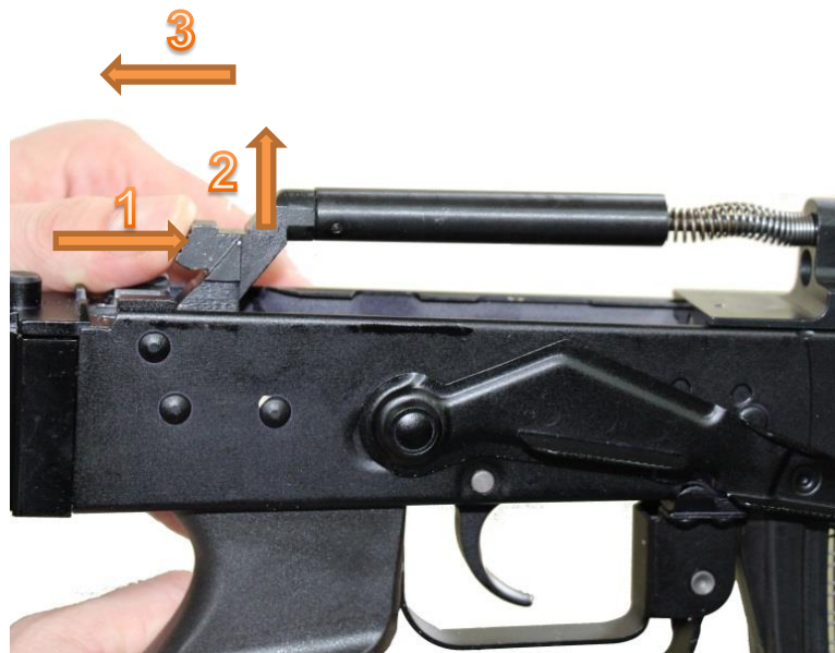
Fot. 8 Odłączanie mechanizmu powrotnego